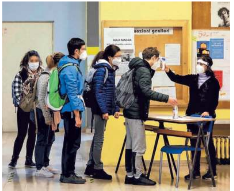
▲ I controlli a scuola con la verifica della temperatura