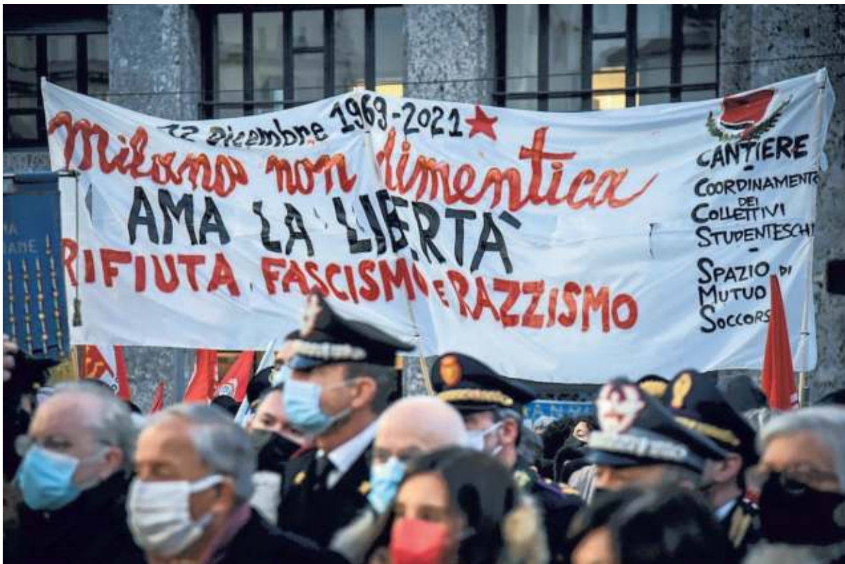
▲ Il ricordo Un momento della commemorazione di ieri in piazza Fontana